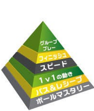
クーバー・コーチング プレーヤー育成ピラミッド

ウィール・クーバー氏の『サッカーの勝敗を決定づけるのは、選手個人の資質による』という理念により生まれたクーバー・コーチング。その特徴ともいえる「1v1 ムーブス」のバリエーションは、なんと40種類以上！ 個人の技術／戦術を軸にトレーニングをすることで、どんなスタイルのサッカーでも活躍できる選手を目指します。