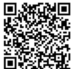
モバイルサイトQRコード

小雨決行ですが、雨量・気温・風・雷・ピッチコンディションなど、状況にもよりますので、開始1時間前に、スクールにお電話、もしくはモバイルサイトにてご確認ください( http://mobile.coerver.jp/ )。