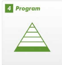
サッカー選手の基礎をつくる綿密なプログラム