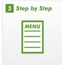
子供の発育に合わせたStep by Stepの練習メニュー