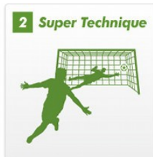
スーパースターたちのテクニックが身につく