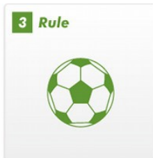
子供1人にボール1個が原則