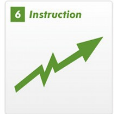
各自のベースにそった指導で、上達が実感できる