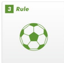
子供1人にボール1個が原則