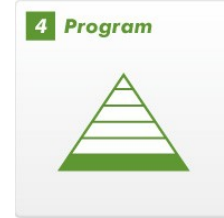
サッカー選手の基礎をつくる綿密なプログラム