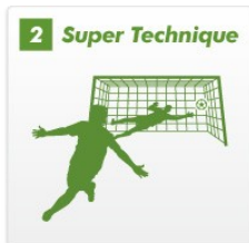
スーパースターたちのテクニックが身につく