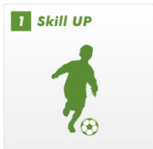
個人の技術を最大限に伸ばす