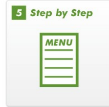
子供の発育に合わせた Step by Step の練習メニュー