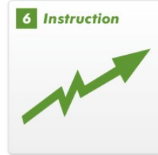
各自のペースに合わせた指導で、上達が実感できる

スケジュール・定員・会費 (税込表示) 入会金 5,500円 登録事務手数料 3,300円